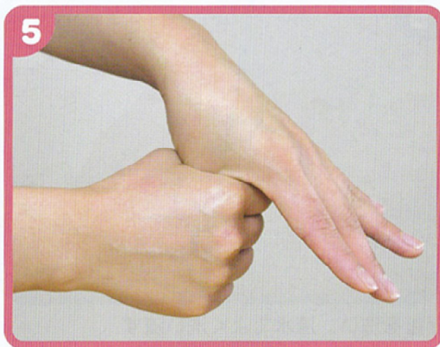
親指にもよくすりこむ