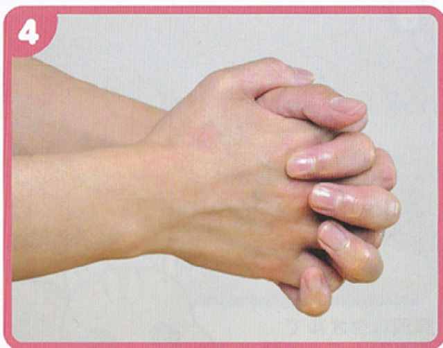
両手の指の間にもよくすりこむ