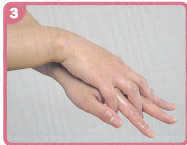
手の甲と横の部分をもう一方の手のひらでこすり、よくすりこむ