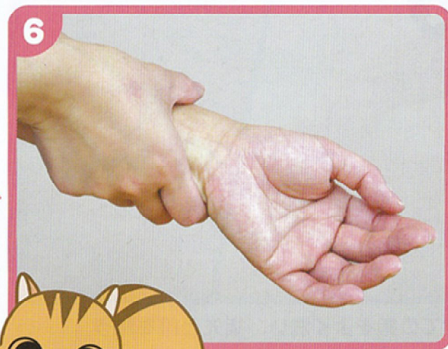
手首にもよくすりこむ