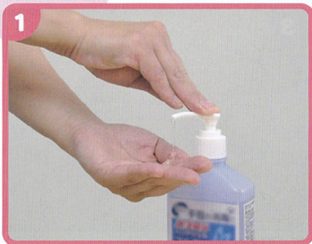
消毒薬(アルコールなど)を十分量、手のひらにとる